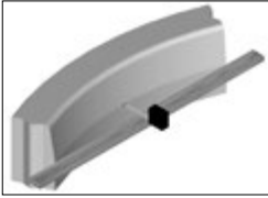
porring meten inwendig (afb.: 13 / 15, R = 1 m)